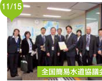
全国簡易水道協議会