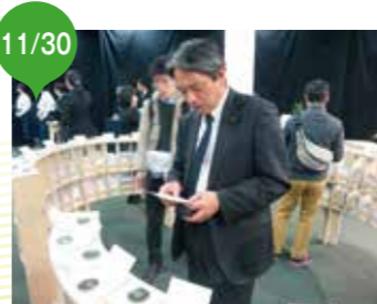
TOKYO TEA PARTY 2018(日本茶AWARD) 「古くて新しい日本茶の文化」を広めるイベントで、たくさんの香り高い静岡茶に出会う