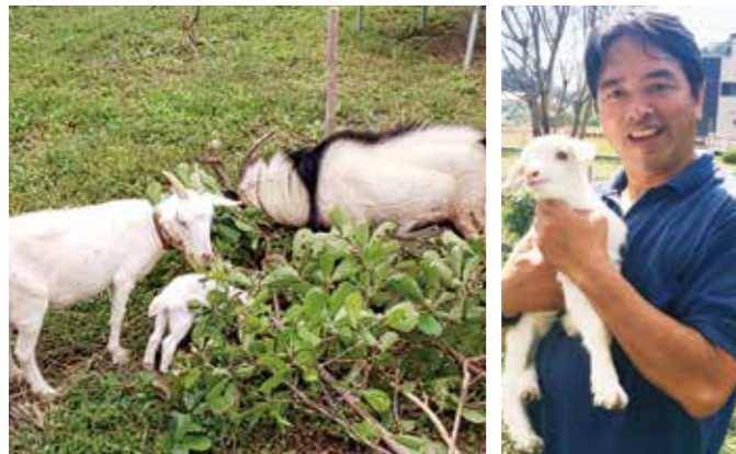
アナお母さん・チャーミー・ケビンお父さん チャーミー

榛葉家で飼育しているヤギの家族です。 9月30日にはチャーミーが生まれ、ますますにぎやかに!