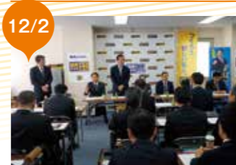
総力を結集して戦うことを確認した