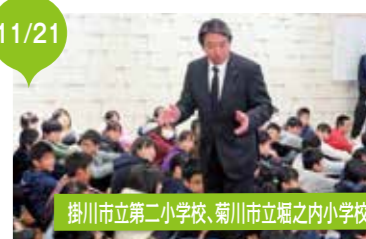
掛川市立第二小学校、菊川市立堀之内小学校 子供たちに国会の役割を説明