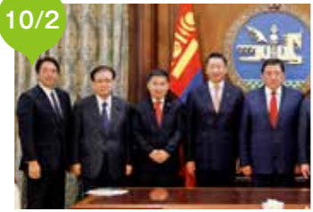
インボルド国家大会議議長 訪問