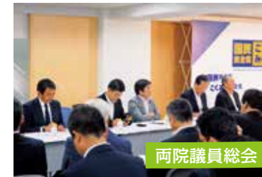
党の執行役員として両院議員総会に臨む