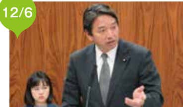
本会議前に国会状況や法案に対する党の方針を説明