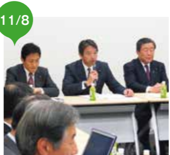
ハンセン病問題の最終解決を進める国会議員懇談会 事務局長として、会の進行役を担う

事務局次長として、全国各地での奉祝事業推進の呼びかけ、また、中央における奉祝行事運営に携わる