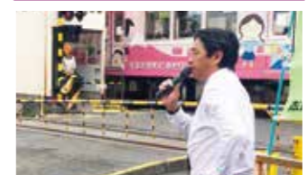
静岡鉄道 御門台駅にて