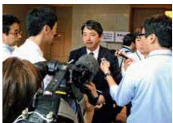
参議院幹事長として取材を受け、情報発信を行う