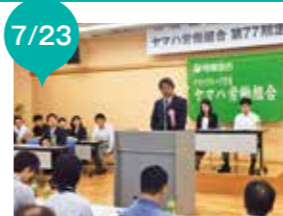
ヤマハ労働組合(電機連合)