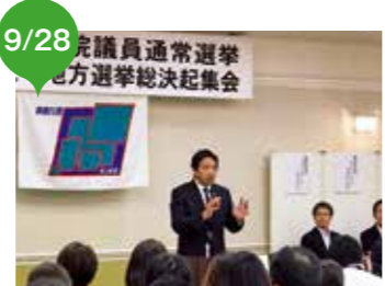
参議院議員通常選挙・統一地方選挙 総決起集会