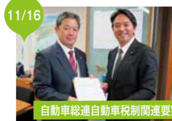
自動車総連自動車税制関連要望