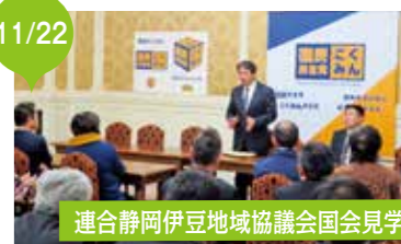
連合静岡伊豆地域協議会国会見学 ようこそ国会に!