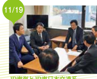
JR東海とJR東日本交通系 ICカード相互利用促進静岡協議会議員連盟・要望活動