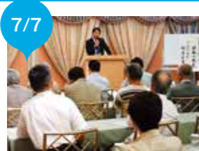
静岡県ソフィア会(上智大学OB)