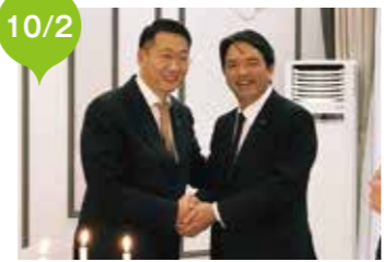
エンファミンガラン副議長主催 夕食会