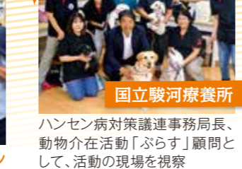
国立駿河療養所 ハンセン病対策協議連事務局長、動物介在活動「ぶらす」顧問として、活動の現場を視察