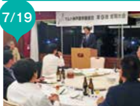
マルト神戸屋労働組合(UAゼンセン)