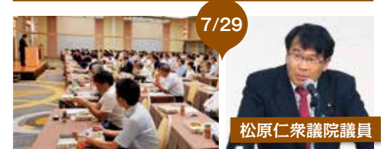
松原仁衆議院議員