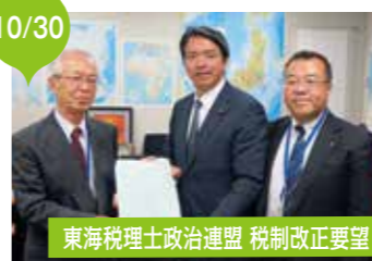
東海税理士政治連盟 税制改正要望

JR連合国会議員懇談会・会長として、自然災害による被災鉄道の状況報告、並びに支援要望を行う