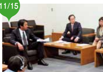
天皇陛下御即位三十年奉祝国会議員連盟 設立

事務局次長として、全国各地での奉祝事業推進の呼びかけ、また、中央における奉祝行事運営に携わる