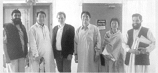
パキスタンの現地NGO代表らと会談