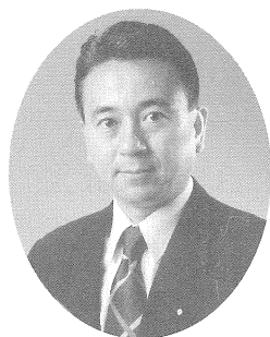
静岡県第8区 比例 衆議院議員 鈴木康友