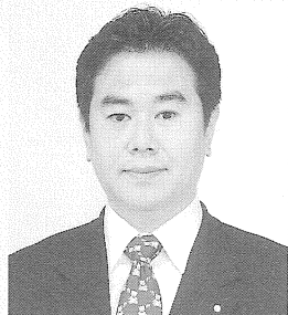
衆議院議員 原口一博先生

【「次の内閣」大臣】 規制改革担当大臣 人権・消費者問題担当大臣 子ども政策担当大臣