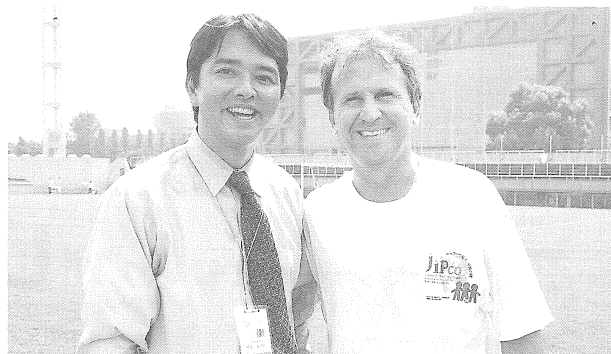
2003年8月22日「イスラエル・パレスチナ・日本の子供たちによる親善サッカー大会」東京西が丘サッカー場にて

ジーコがサッカーの『神サマ』と呼ばれていると知ったのはその後のことだった。優しく、気さくな『神サマ』とのコミュニケーションで、サッカーがちょっとだけ好きになった。