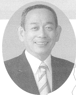
静岡県第1区 衆議院議員 牧野聖修