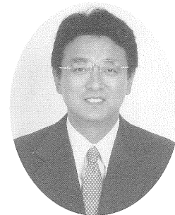
静岡県第6区 衆議院議員 渡辺 周