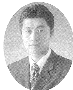
静岡県第5区 衆議院議員 細野豪志