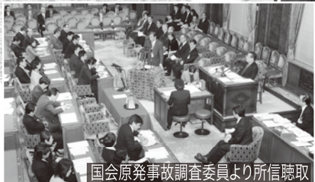
国会原発事故調査委員より所信聴取

敬愛していた西岡参議院議長急逝に伴う人事で、「ねじれ国会」運営の責任者である議院運営委員会筆頭理事に就任。就任早々、国会原発事故調査委員会設置やサイバーテロ対策などに奔走する。