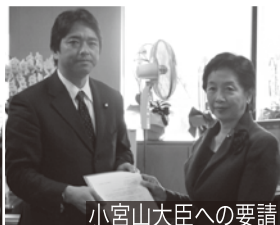
小宮山大臣への要請