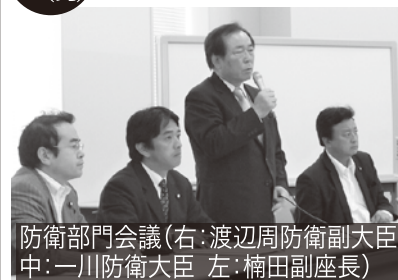
防衛部門会議(右:渡辺周防衛副大臣 中:一川防衛大臣 左:楠田副座長)

民主党防衛部門会議座長に就任。政府と与党の調整、円滑な部門会議運営に尽力。また、内閣・外務・防衛部門による合同の「国際平和協力活動(PKO)に係る勉強会」を座長として取り仕切る。