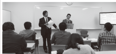
東日本大震災で現地で指揮にあたった陸上自衛隊幹部との講義

10月から週1回のペースで、中央大学大学院公共政策研究科にて客員教授として教鞭を執る。主に地方自治の現場などを志す学生に対し、与党の政策決定の仕組みや、立法府を支える多くの裏方の重要性などを紹介。講義には第一線で活躍するゲストを招くことも試みた。