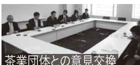
茶業団体との意見交換

11月15日にお茶の放射能規制値設定について茶業団体と意見交換を行った。それを受け民主党静岡県茶業振興議連会長として、化学的根拠に基づき且つお茶の特性に即した設定をすべきとする要請を小宮山厚労大臣に行った。