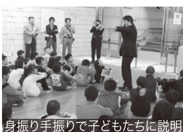
身振り手振りで子どもたちに説明

震災の影響で春夏に国会見学を予定していた学校の多くは秋冬に日程を変更。会議の合間を縫って駆けつけ、数分間で国会の仕事の説明。「国会は何をすること?」の問いかけに、元気よく答える子どもたち。時々出る珍(名?)回答も、一時の癒しとなった。