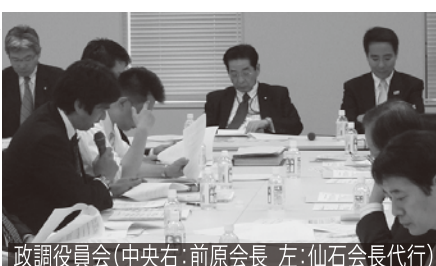
政調役員会(中央右:前原会長 左:仙石会長代行)

野田総理を代表とする民主党新体制において、前原政調会長を補佐する政調副会長に就任。与党の安全保障政策を主導すると同時に、政調役員として東日本大震災復旧・復興プロジェクトチームに参画。