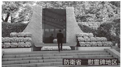
防衛省 慰霊碑地区

国の防衛という崇高な職務を遂行され、国家のために尽力された自衛隊員の御霊に対し、心よりの感謝と謹んで哀悼の誠を捧げ、献花を行う。